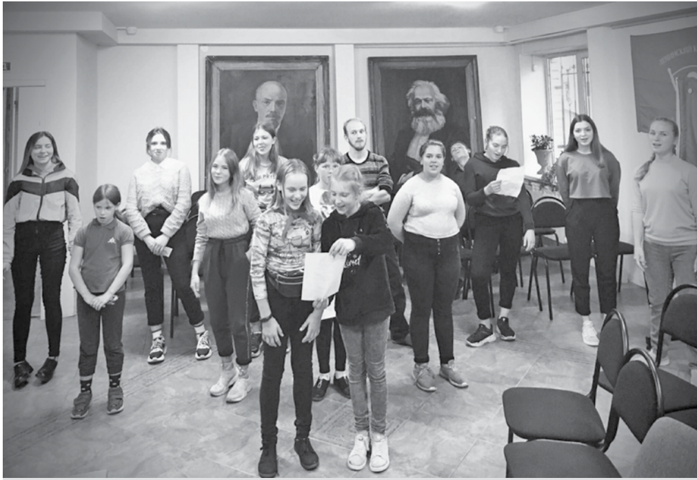
Пионеры и комсомольцы, еще не состоящие в Агитбригаде, присоединяйтесь!