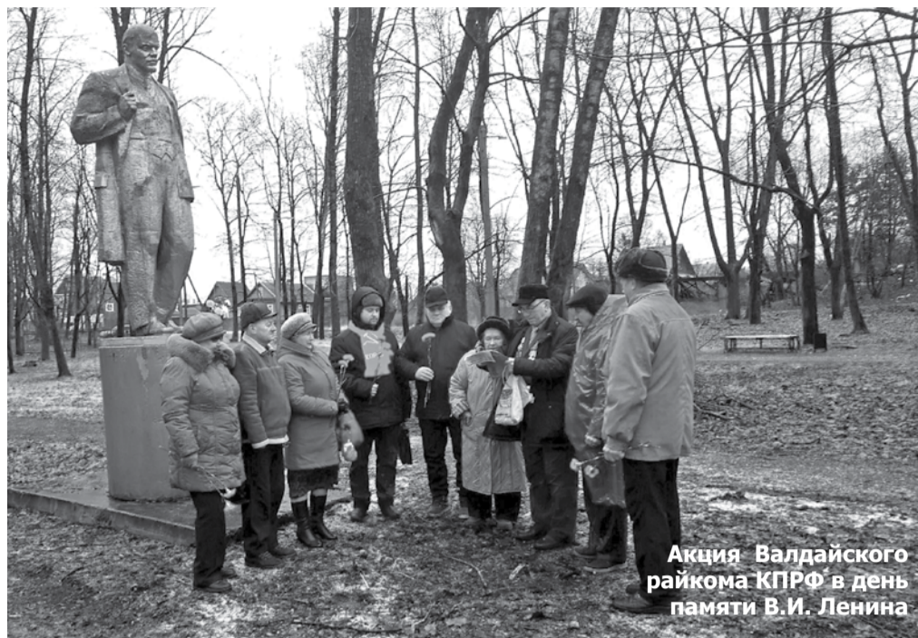
Акция Валдайского райкома КПРФ в день памяти В.И. Ленина