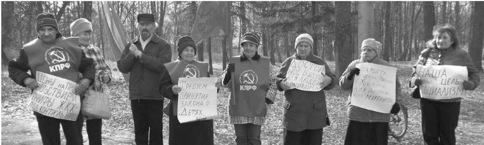
ПИКЕТЧИКИ ХОЛМСКОГО РАЙКОМА КПРФ

Мы верим, что общими усилиями сможем добиться проведения водопровода для людей. Если среди читающих есть жители деревни Трубичино, то просим присоединиться к нашему общему делу!