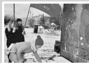
Смена держав — стр. 7