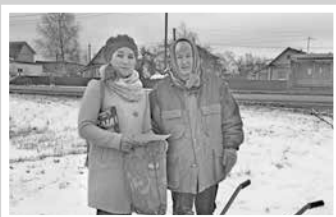
Как работает правительство — стр. 4