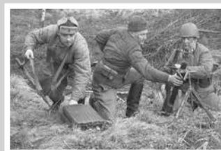
К освобождению от оккупантов — стр. 6