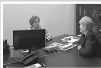
Дела депутатские — стр. 5