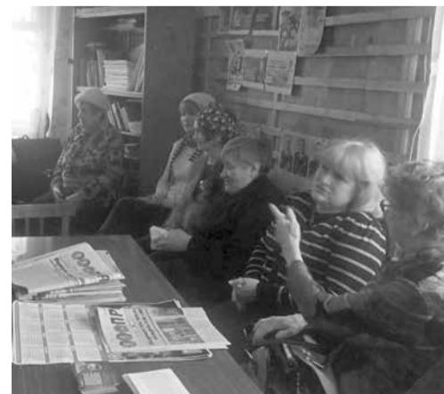
Жители Пестова в райкоме КПРФ рассказывают о своих проблемах.