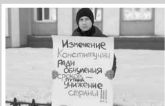
Смена – стр. 3