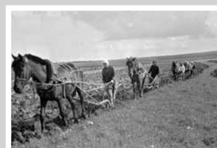
Деревня моя, деревянная, дальняя – стр. 6