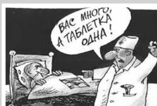
Проблемы здравоохранения – стр. 4–5