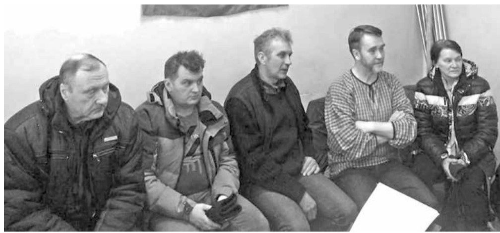
Инициативная группа жителей района в райкоме КПРФ

Статья 3 Конституции гласит, что высшим непосредственным выражением власти народа являются референдум и свободные выборы, что никто не может присваивать власть в России, а статья 12 гласит, что в России гарантируется местное самоуправление и оно самостоятельно в пределах своих полномочий. Поэтому орган местного самоуправления не может принять решение о ликвидации, ибо это не орган самоуправления депутатов, а орган самоуправления народа. Депутаты могут вместе с главой поселения только самораспутиться или уйти в отставку. Учитывая все это, население села считает, что решение депутатов Песского поселения антиконституционно и является преступлением согласно гл. 29 УК РФ.