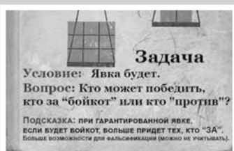
Партийная жизнь – стр. 2