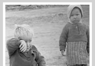
Дети войны вспоминают – стр. 7