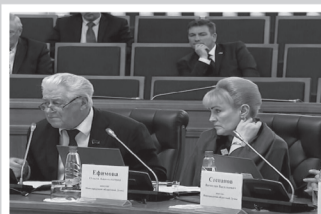
Фракция КПРФ – стр. 4