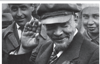
Отметили юбилей Ленина – стр. 2