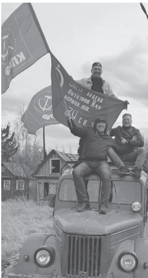
Флэшмоб Старорусского райкома КПРФ