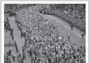
К 75-летию победы – стр. 6–7