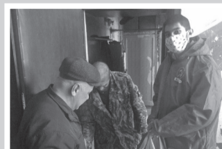
Своих не бросаем – стр. 5