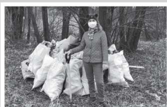
Смена – стр. 3