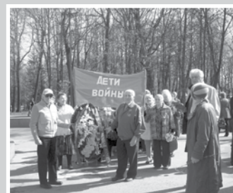
Растет и крепнет армия «Детей войны» — стр. 6