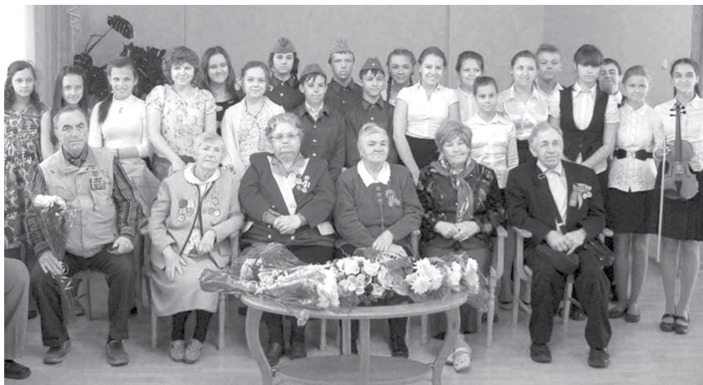
«Дети войны» на мероприятии «Детство, опаленное войной»

Мы, дети войны, пришли на смену нашим дорогим отцам – участникам Великой Отечественной войны. Наше поколение тоже можно назвать героическим. Малолетние узники, блокадники, сыны полков, разведчики, партизаны – кто мы такие. Так разве мы не участники этой страшной войны? А все еще ждем и надеемся, что получим от государства официальный статус и какие-то льготы.