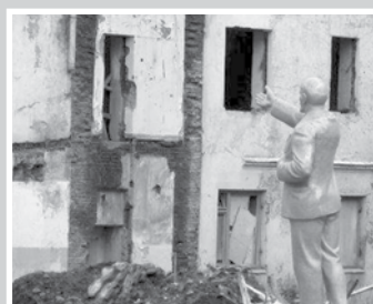
Взгляните на наши заводы — стр. 5