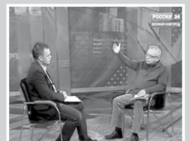
Покой нам только снится — стр. 7