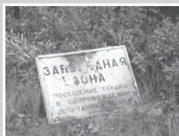
Чтобы автобан прошел мимо заповедной зоны, нужно... — стр. 3