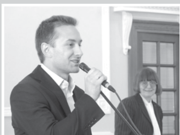
Партийная жизнь — стр. 2