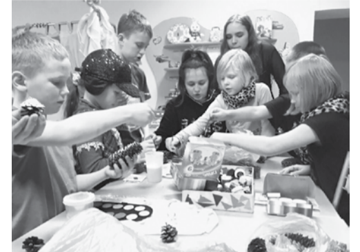
Пионеры учат ребятшек мастерить игрушки на елку

В декабре комсомольцы объявили сбор новогодних подарков для малышей. Каждую неделю они бывают у своих маленьких друзей. То с ними вкусняшки лепят, то игрушки делают, то шишки к новогодней елке раскрывают.