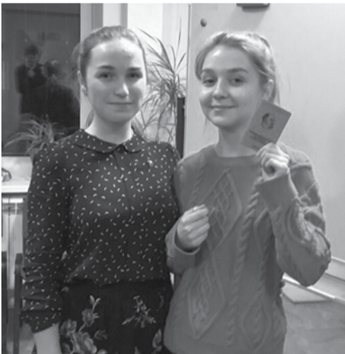
Вот и новый член организации!

В декабре Новгородское отделение ЛКСМ пополнилось новыми членами. В городской организации уже более 20 комсомольцев.