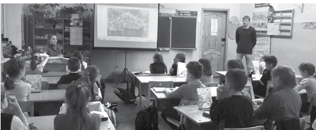
Урок истории пионерского движения проводят члены ЛКСМ РФ

Но и сами комсомольцы не пропускают лекции в обкоме КПРФ и занятия в школе молодого политика, занимаются самообразованием.