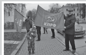
Смена растёт – стр. 7