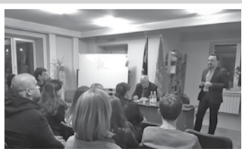
Партийная жизнь – стр. 2