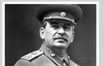
140-летие Сталина и другие даты – стр. 8