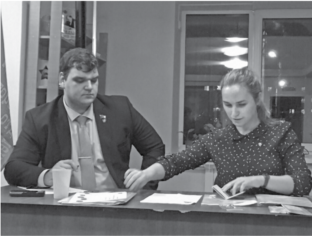
Идет бюро обкома ЛКСМ РФ