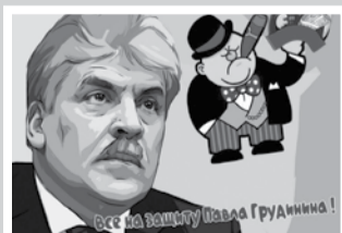
Месяц протестных акций – стр. 4