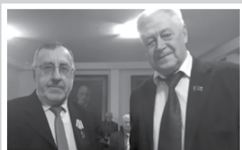
Пленум ЦК – стр. 3