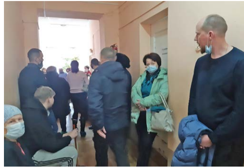
В городской поликлинике

«Оптимизация здравоохранения больно ударила нас, – пояснили ситуацию в райкоме КПРФ. – Два года назад был молодой хирург с женой. Но их не включили в программу «Земский доктор», и они уехали.