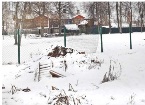
Благоустройство у стадиона

Комья земли, вперемежку с досками и сломанными кустами, деревьями, порванная сетка ограды теперь «украшают» улицу. Парка нет, скамеечек нет, места массового отдыха нет. Кто ж захочет отдыхать на пустом месте в середине проволочной клетки? Зато отчитались – сделали!