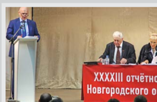
Слово участникам конференции – стр. 4 – 6