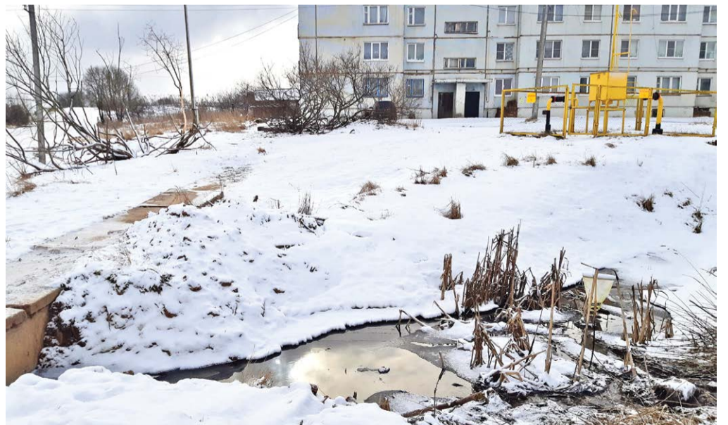
Открытая канализация в Шуркино

Коммунисты надеются, что положение можно исправить, если сформировать крепкую Думу из принципиальных людей. Таких людей надо сейчас искать, выдвигать, поддерживать. Только на них вся надежда.