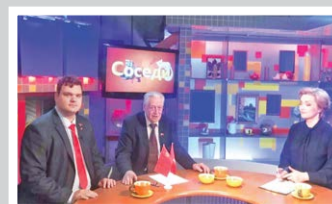
Фракция КПРФ в действии – стр. 7