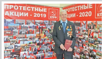
Отчетно-выборная конференция обкома КПРФ – стр. 3