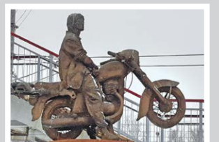
Перемен требуют наши сердца – стр. 8