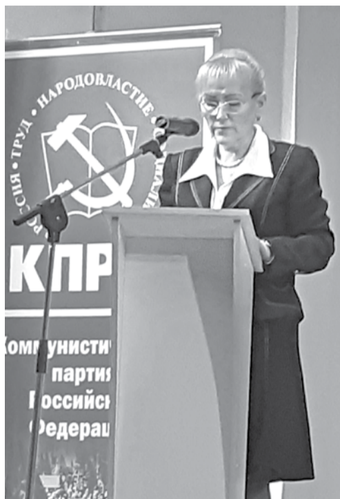
О.А.ЕФИМОВА, второй секретарь Обкома КПРФ: