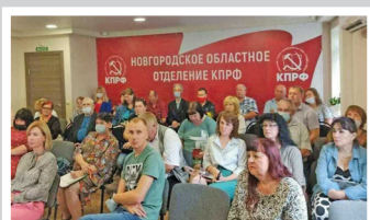
Партийная жизнь – стр. 2