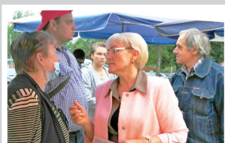
Впереди выборы – стр. 4