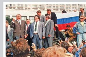
30 лет спустя – стр. 7