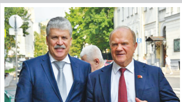
Отстоим Грудина! – стр. 3