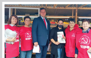
Агитаторы в действии – стр. 5