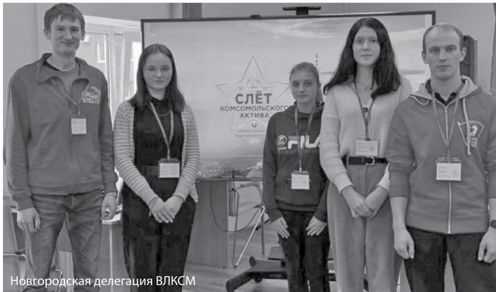
Новгородская делегация ВЛКСМ

Комсомольцы Северо-Запада с удовольствием окунулись в революционную историю нашей страны и получили много новой интересной информации.