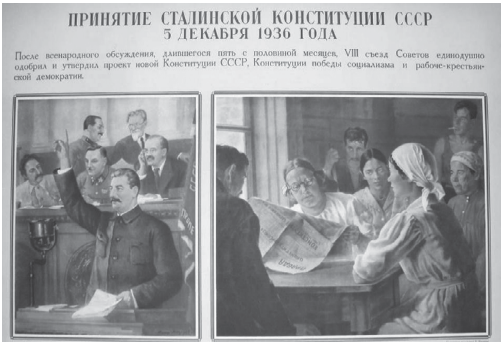
ПРИНЯТИЕ СТАЛИНСКОЙ КОНСТИТУЦИИ СССР 5 ДЕКАБРЯ 1936 ГОДА

5 декабря 1936 года Всесоюзным съездом Советов была принята Конституция СССР, которая получила неофициальное название как «Сталинская»