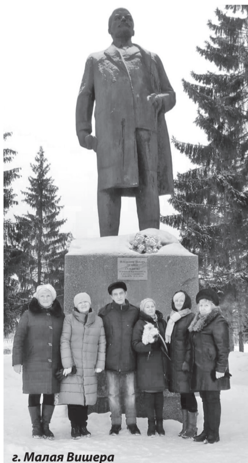
г. Малая Вишера