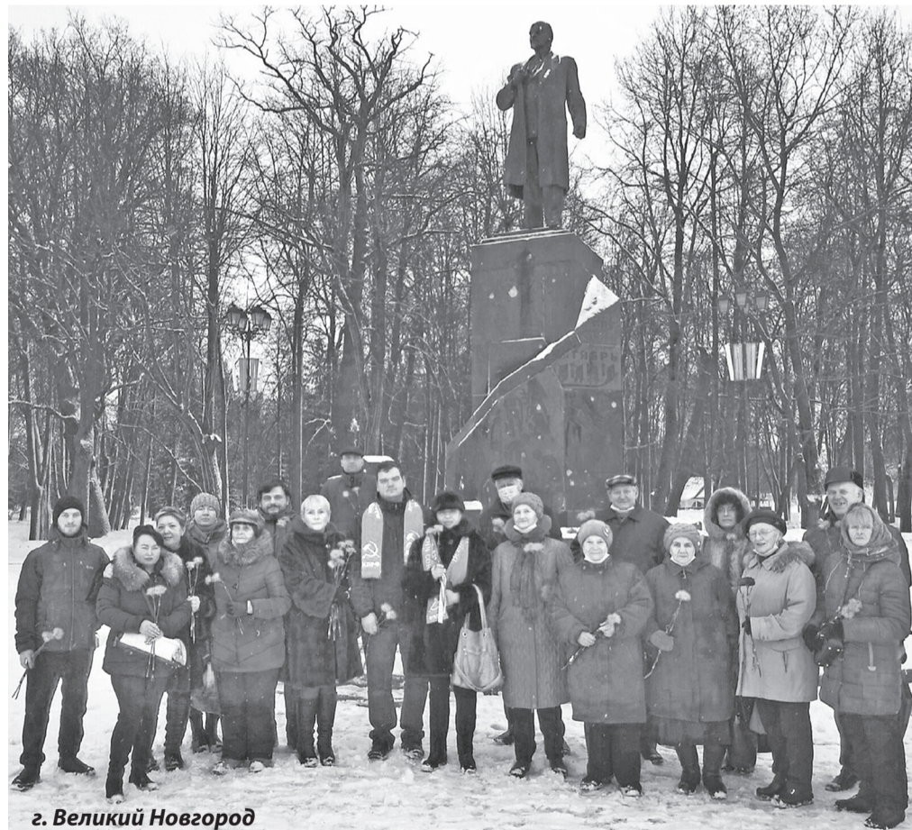
г. Великий Новгород

знамя ленинской правды и боремся за построение социалистического общества по заветам Ильича.