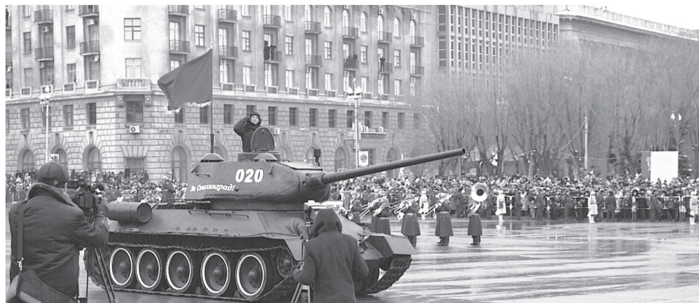
Начало парада Победы в честь 70-летия Сталинградской битвы на главной площади. 02.02.2013 г.

В 2008 году в области проживало 33 участника Сталинградской битвы. В день 65-летия разгрома фашистских войск под Сталинградом торжественные мероприятия охватили всю Новгородскую область, но особо ее отмечали участники Сталинградской битвы. В Волгограде 1–2 февраля тоже прошли торжественные мероприятия, где присутствовали особые почетные гости-ветераны и воины-защитники Сталинграда, на которые была приглашена и новгородская делегация.