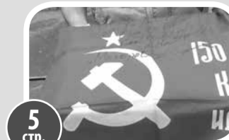
5 стр. Все для фронта