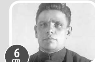
6 стр. По комсомольской путевке