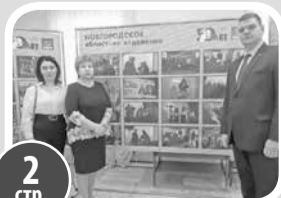
2 стр. Семинар-совещание партийного актива СЗФО