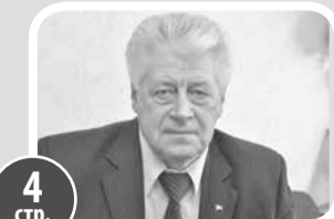
4 стр. Вернуть городу-герою имя Сталинград