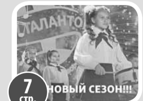
7 стр. Земля талантов–2023