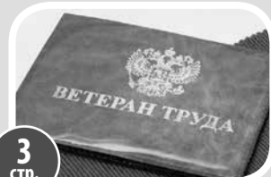
3 стр. О статусе ветерана труда