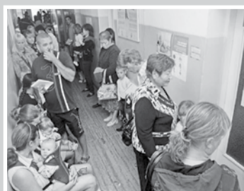
На кону последнее – стр. 5