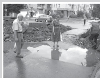
Назад, к Скотопригоньевску! – стр. 6