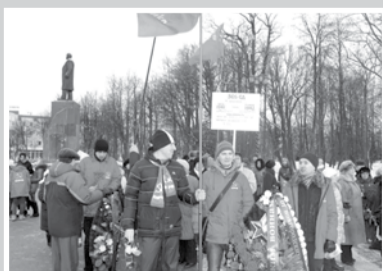
Партийная жизнь – стр. 2