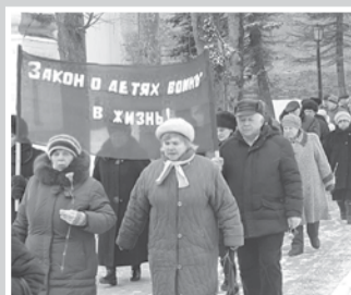
Покуда сердца стучат – стр. 3