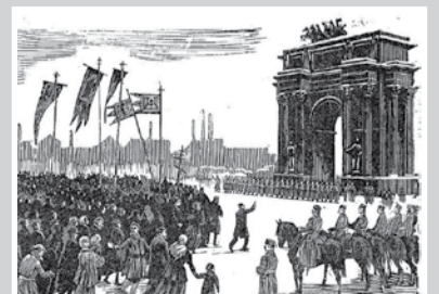
К 110-летию Первой Русской революции – стр. 7