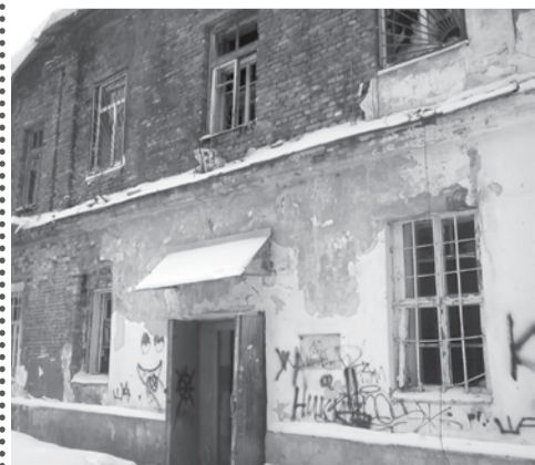
На фото: здание военного госпиталя в Великом Новгороде