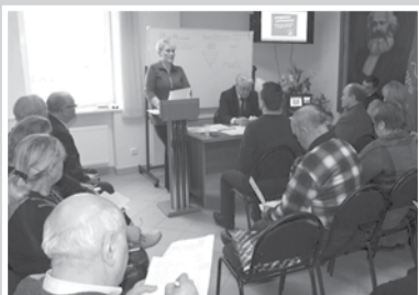
Партийная жизнь – стр. 2