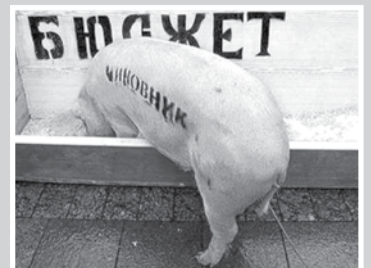
Чиновники и бюджет – стр. 8