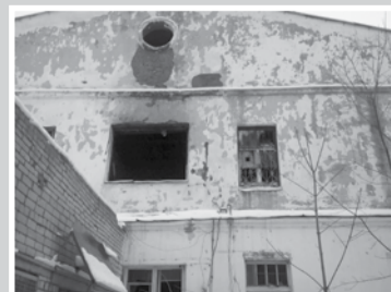
Из редакционной почты – стр. 7