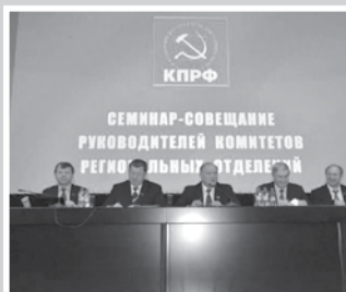
Время действовать! – стр. 3