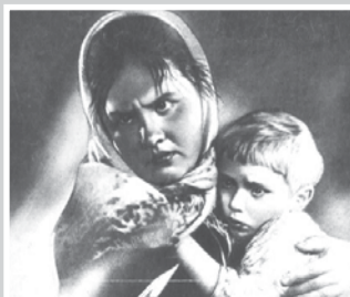
К штыку приравняли перо – стр. 4