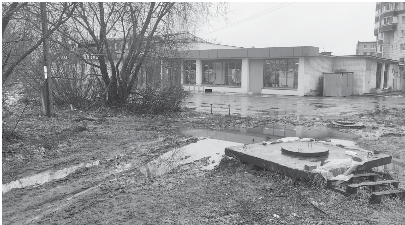
А ограждение где? Стихийный проезд на пр. Корсунова