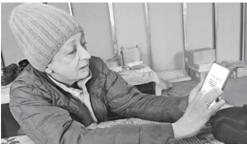
Народные деньги шли на счёт «Крестцы для Победы» и во время нашего разговора

Раннее утро, а в просторном помещении на втором этаже местного торгового центра уже вовсю кипит работа. Несколько женщин плетут маскировочные сети под «присмотром» местного талисмана – симпатичного и такого же любовно сплетённого местными мастерицами паучка. Чуть вдалеке – стол с разложенными на нём деталями маскхалата для снайперов «Леший». Скоро подойдёт специалистка по его шитью и примется за работу: пять таких «костюмов» ежемесячно уходят на фронт. Вдоль стен – мешки с вещами, коробки с продуктами, лекарствами, рулоны готовых сетей и упаковочных материалов. Таковую картину здесь можно наблюдать практически каждый день. Двери мастерской закрываются разве что на ночь.