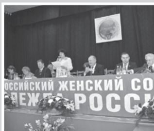
Партийная жизнь – стр. 3