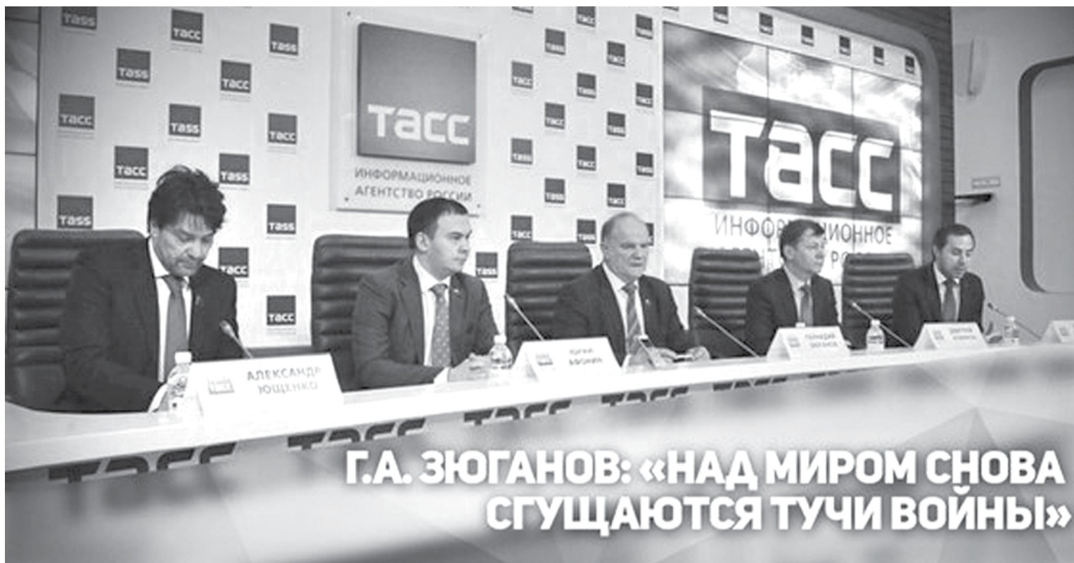
7 апреля в Москве, в ИА ТАСС состоялась пресс-конференция лидера КПРФ Г.А. Зюганова, посвященная «декоммунизации» Украины.

«Сейчас над миром снова сгущаются тучи войны, сказал Г.А. Зюганов.— Уже подожгли войну в Новороссии, пытаются столкнуть лбами два братских народа. И все это происходит на фоне углубляющегося финансово-экономического кризиса. На этой неделе Государственная Дума будет принимать новый, максимально урезанный бюджет, от которого стране не станет лучше. Скорее кризис, после принятия такого бюджета, будет только углубляться».