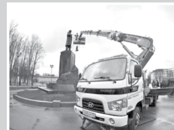
К юбилею В.И. Ленина – стр. 8