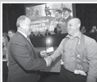
Пленум ЦК КПРФ – стр. 4 – 5