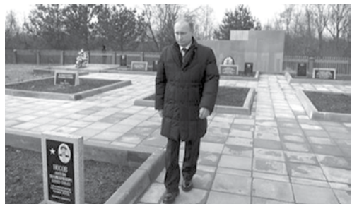
Президент РФ на братском захоронении в дер.Марфино Старорусского района

После встречи в Старой Руссе с поисковиками и ветеранами Президент РФ поручил Минобрнауки восстановить раннее патриотическое воспитание молодежи, сообщает РИА новости.