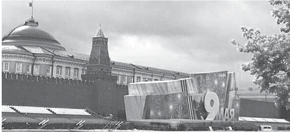
Мавзолей в мае 2010 года

В постановлении Пленума ЦК КПРФ дается поручение Президиуму и Секретариату ЦК КПРФ, партийным комитетам всех уровней, Общероссийскому штабу по координации протестных действий фракции КПРФ в Государственной думе ФС РФ настойчиво добиваться возвращения дню 7 ноября статуса государственного праздника — Дня Великой Октябрьской социалистической революции , а также отмены практики драпировки Мавзолея В.И. Ленина в ходе официальных мероприятий на Красной площади и искажения тем самым её исторического облика.