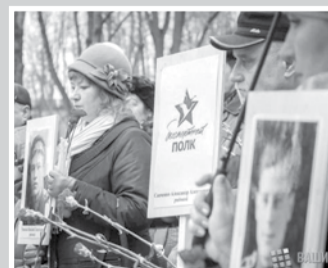
Вечен ли огонь памяти – стр. 6 – 7