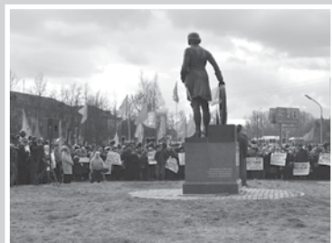
Красная весна идет по области – стр. 2