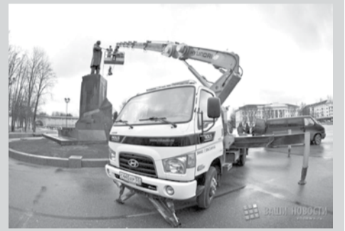
В Великом Новгороде к юбилею Ленина приводят в порядок памятник основателю первого в мире социалистического государства

В областном центре возложение цветов к памятнику В.И.Ленину намечено провести 22 апреля в 12 часов дня.